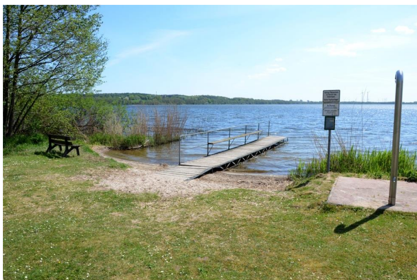
Abbildung 1: Bild der Badestelle

Die großzügige, als Freizeitanlage ausgestaltete Badestelle liegt innerhalb der Ortslage Groß Wittensee. Das ebene Wiesengelände bietet Liegeplätze mit und ohne Schatten. Ein Badesteg, Dusche und Toilettenanlage sowie ein Beachvolleyballfeld sind vorhanden. Andere Bedürfnisse hinsichtlich der Infrastruktur werden im Bereich des Ortes abgedeckt.